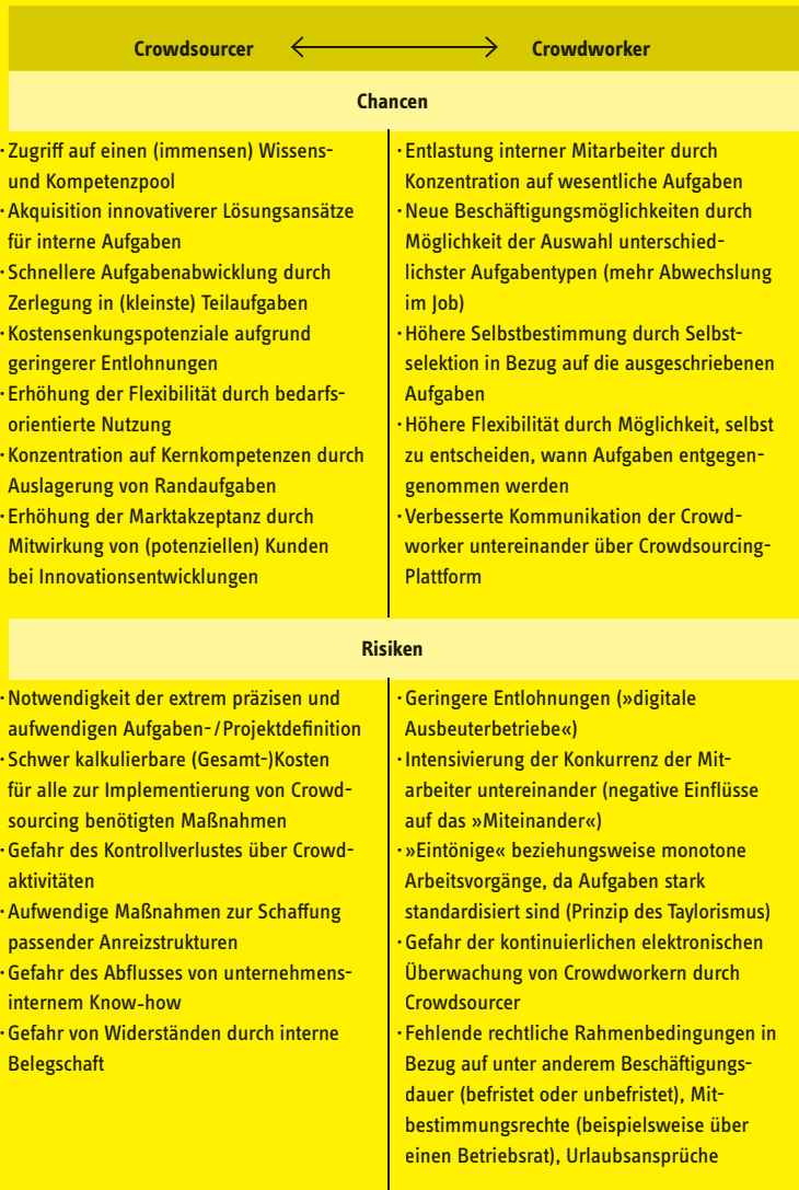
Abb. 5 Chancen und Risiken für Crowdsourcer und Crowdworker.